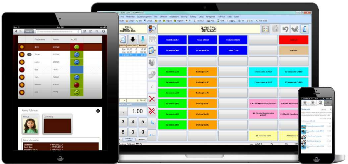
↑ Links: Leerlingengolvstelsysteem • Midden: Kassasoftware • Rechts: Mobile membership